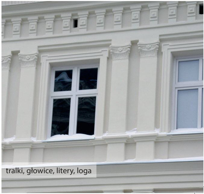
tralki, główce, litery, loga